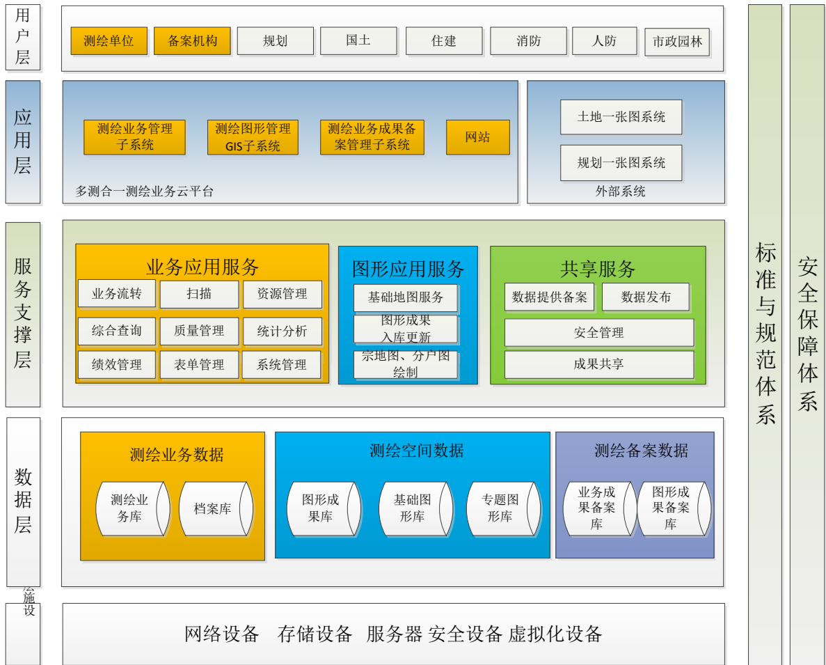
多测合一管理云平台总体架构

多测合一管理云平台由三个子系统和门户网站组成。三个子系统分别为：测绘业务管理子系统、测绘图形管理 GIS 子系统、测绘业务成果备案管理子系统。